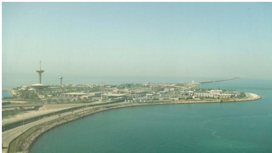
巴林沙特跨海大桥及海中人工岛