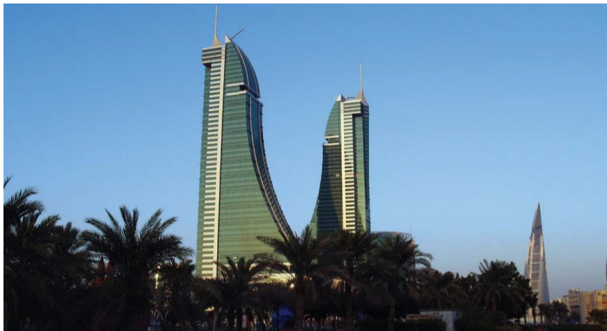
巴林金融港和世界贸易中心